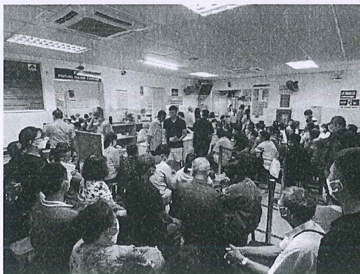
Ảnh: Người bệnh thực hiện thủ tục phẫu thuật tại Khoa Tổng hợp.

Mỗi ngày, Bệnh viện Mắt thực hiện từ 350 - 400 ca mổ phaco điều trị đục thể thủy tinh. Cao điểm, bệnh viện có ngày tiếp nhận 500 bệnh nhân khám và đăng ký phẫu thuật, dẫn đến quá tải. Từ đầu năm 2023 đến nay, bệnh viện đã phẫu thuật cho 55.968 bệnh nhân đục thể thủy tinh, trong đó hơn 41.150 ca là bệnh nhân ở các tỉnh thành khác.