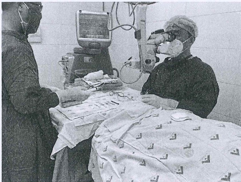
Ảnh: Một ca phẫu thuật phaco vào ngày thứ 7

Đây là một giải pháp, sáng kiến cải cách hành chính cấp thiết mà Bệnh viện Mắt thực hiện nhằm đáp ứng nhu cầu phẫu thuật phaco ngày càng tăng của người bệnh có bảo hiểm y tế, hướng đến sự hài lòng của người bệnh.