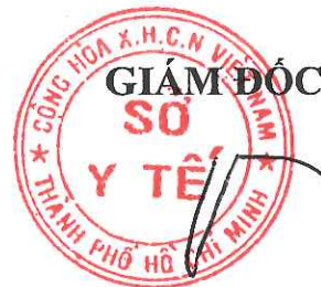
Tăng Chí Thượng