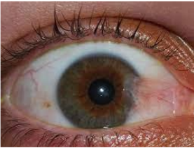
Mộng thịt lan vào giác mạc